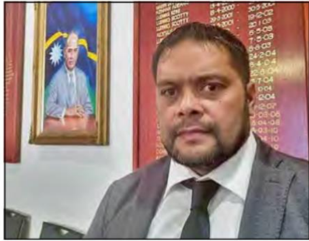
The new President of Nauru, Russ J. Kun.