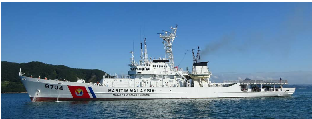
KM ARAU (旧おき)