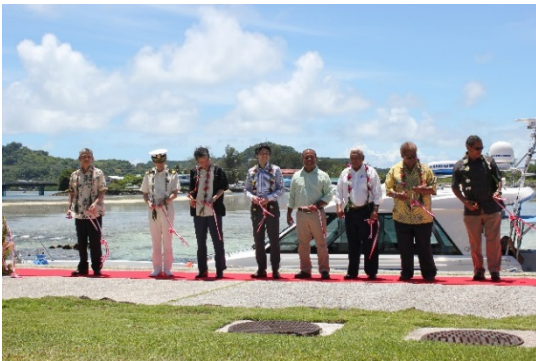
パラオと日本の代表者によるテープカット