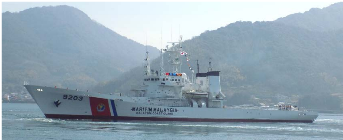
KM PEKAN (旧えりも)