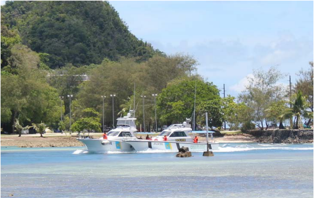
セレモニーの開会前に、2隻目のパトロール艇「BUL」を遠反船に見立てて、今回供与された「EUATEL」による取り締まりのデモンストレーションが行われた