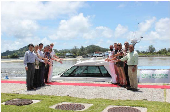
「EUATEL」をバックに記念撮影