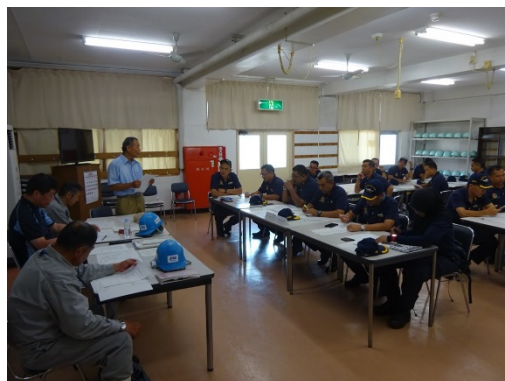
座学訓練中の MMEA 職員

教育訓練は、マレーシアの準公用語である英語で実施したが、設備や機器の詳細説明、操作訓練をするにあたっては、誤解がないよう MMEA 職員と十分意思疎通を図りながら、一つひとつ確実に訓練を行うとともに、MMEA 職員間でも相互にマレー語で理解を深めてもらえるよう時間に配慮した訓練を実施した。