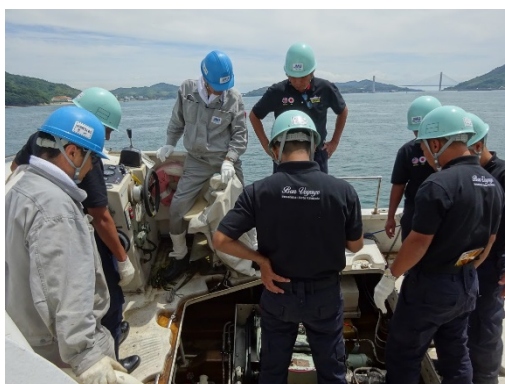
搭載艇の機関操作説明